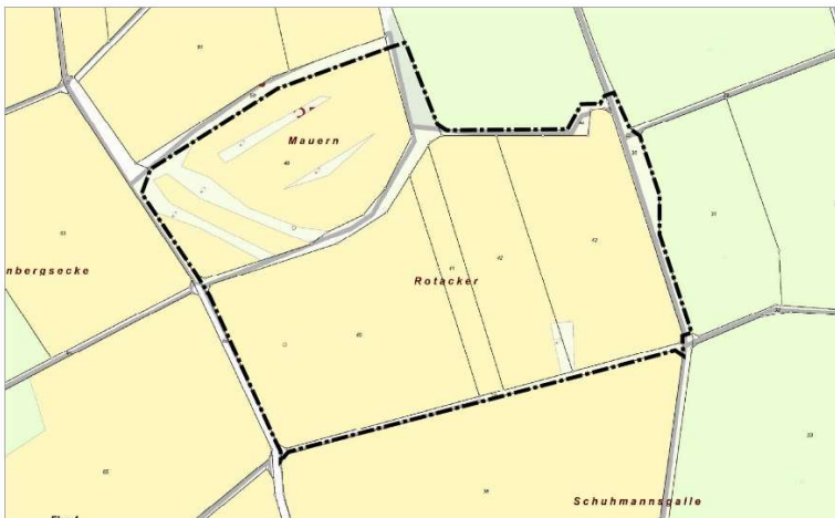
Ausschnitte genordet, ohne Maßstab